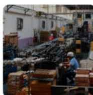
Empresas de transformación alimentaria

Deben indicarlo directamente en el propio etiquetado del producto, que debe ser claro y legible.